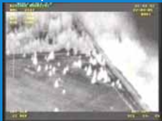
Contraste thermique entre une zone de fagne et des peuplements résineux