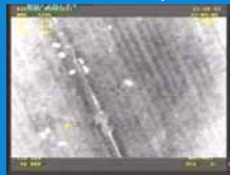
Observation détaillée : en absence de couvert dense le dénombrement des animaux est possible