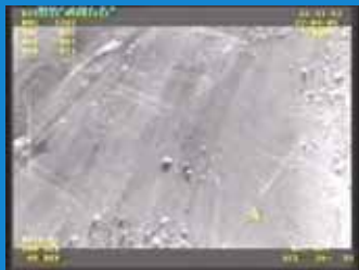
Paysage de Fagne en vue thermique

Le B-Hunter (de conception israélienne) est l'avion espion entièrement télécommandé utilisé par l'Armée belge : il est équipé de caméras, dont une thermique, permettant des observations de nuit.